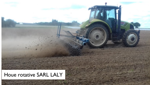
Houe rotative SARL LALY

Ici, notre objectif est de permettre aux exploitants volontaires de se former au suivi des parcelles (développement des adventices, stade du maïs) et de se familiariser à l'utilisation des outils (lequel et quand ?), tout en sécurisant le résultat puisqu'un rattrapage chimique reste possible si les adventices menacent de dépasser le seuil de nuisibilité pour le maïs. En effet, cette technique est conditionnée par de nombreux paramètres ; certains maîtrisables par l'agriculteur et d'autres devant lesquels il restera impuissant à savoir la météo. Cette pratique demande des connaissances sur la préparation du sol, le semis (la dose, la profondeur) et les outils de désherbage mécanique à utiliser en fonction du stade de la culture (herse étrille, houe rotative, bineuse).