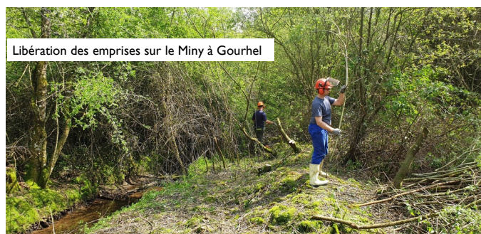
Libération des emprises sur le Miny à Gourhel

✓ Les travaux de réhabilitation des cours d'eau sur l'Yvel ont démarré en mai.