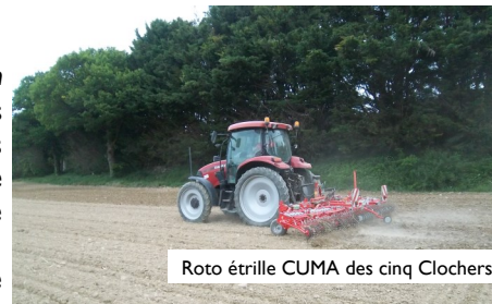
Roto étrille CUMA des cinq Clochers

La réduction des produits phytosanitaires devient une nécessité réglementaire ( Plan Écophyto ) et environnementale. En 2019, le SMGBO, avec l'appui du Groupement des Agriculteurs Biologique du Morbihan, accompagne 13 exploitants volontaires répartis sur l'ensemble du territoire pour tester le désherbage mécanique sur une parcelle de maïs. Dans le cadre des actions de bassin versant, le SMGBO prend à sa charge le coût du conseil pour déclencher le passage d'outil et le passage du matériel (max.3 passages), pour une surface de 3 hectares maximum par exploitant intégré dans ce dispositif.