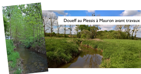
Doueff au Plessis à Mauron avant travaux

OCRE a réalisé 155 ml de risbermes végétales. L'intérêt de cette technique est de pouvoir travailler sur des petits cours d'eau élargis artificiellement et dont le fond du lit est colmaté. L'objectif est de resserrer le lit du ruisseau pour chasser les limons vaseux. Le lit du cours d'eau ainsi décolmaté, nous retrouvons des fasciés d'écoulement plus naturels, favorisant une recolonisation d'une faune riche et variée.