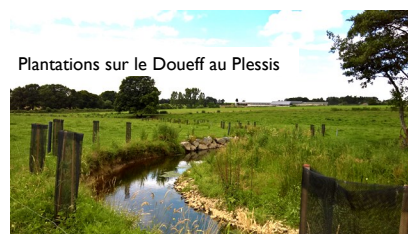
Plantations sur le Doueff au Plessis

Chênes, frênes, charmes, aulnes et merisiers ont été plantés sur les berges de la nouvelle rivière au Plessis à Mauron. Ce site a connu des travaux de renaturation en 2017.