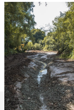
Remise en talweg Rivière de Cô-Maleville

Les travaux se poursuivront en septembre à l'amont, toujours sur la commune de Ploërmel.