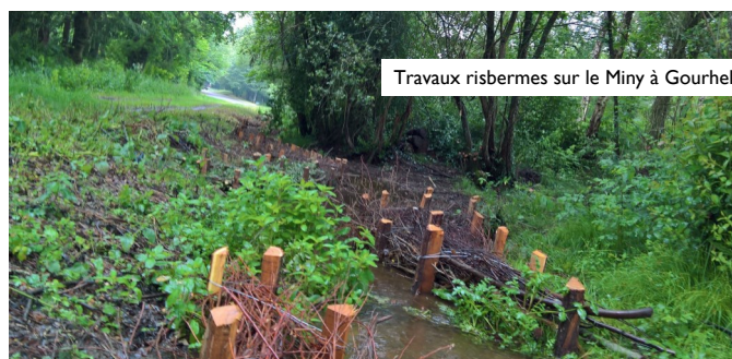
Travaux risbermes sur le Miny à Gourhel

L'entreprise OCRE a entrepris la libération des emprises sur une partie boisée afin d'accéder au cours d'eau. L'entreprise CALOU TP engagera des travaux de réhabilitation sur 200ml par l'apport de matériaux schisteux formant des radiers et des banquettes. L'objectif de ces travaux est de créer une diversité des habitats et des écoulements, et également favoriser des débordements en période hivernale.