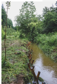
Création de sous berges Rivière de Cô-Maleville

Les travaux ont commencé début juin sur la rivière du Cô-Maleville, située au sud de la commune de Ploërmel.