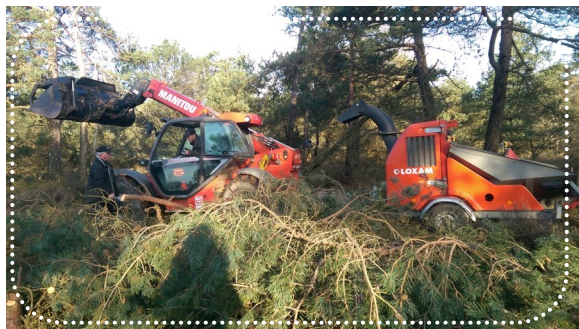
Broyage et exportation des branches et têtes de pins

Les espèces caractéristiques des landes sèches devraient reprendre rapidement compte tenu du retour en lumière des zones ciblées. La parcelle retrouvera également le caractère pittoresque pour lequel elle avait fait l'objet d'un classement en site classé.