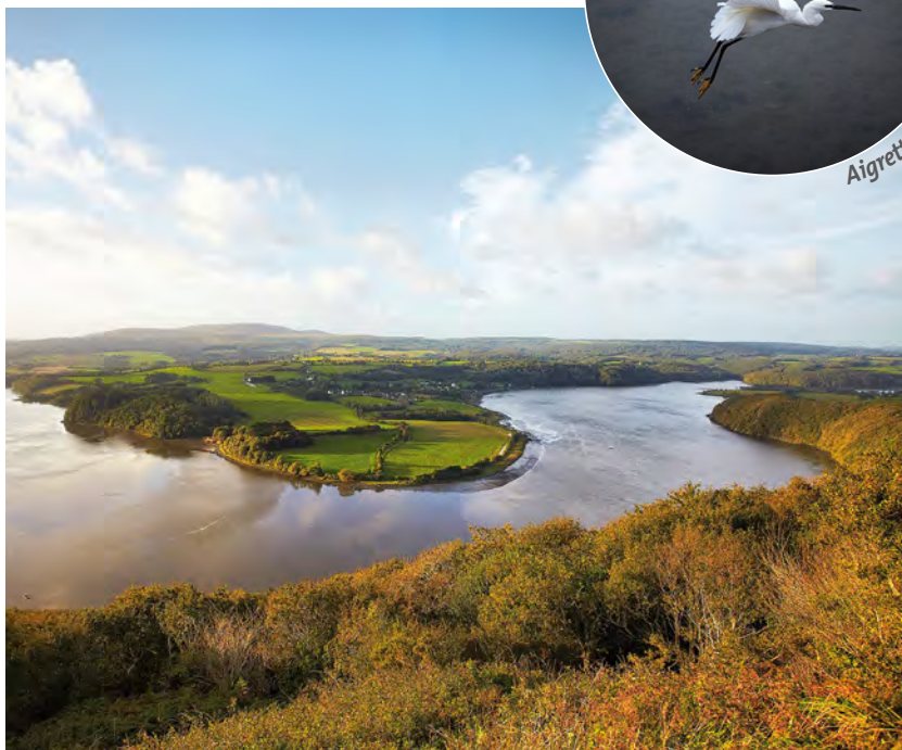
Les boucles de l'Aulne à Dinéault.

Son objectif est de trouver un équilibre entre la protection durable de la qualité de l'eau, la préservation des milieux aquatiques et le développement économique local.