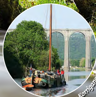
Péniche Korriganerz