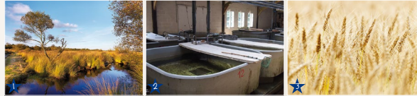
1 - Espaces naturels remarquables. (© A. Lamoignon). 2 - Piscicultures. (© EPASA). 3 - Cultures céréalières. (© A. Lamoignon)