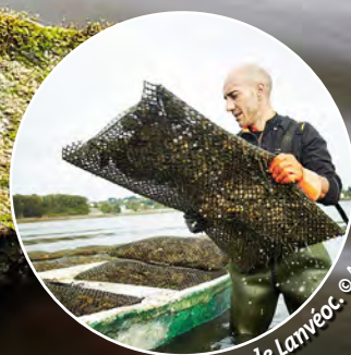
Ostréiculteur de Lanvéoc