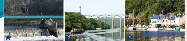
1 - Lutte contre les crues (Spilly Glaz). (© Conseil général 29). 2 - Navigation. (© JY Creux). 3 - Port de plaisance. (© A. Lamoignon)

Plans d'eau principaux : le réservoir de Saint-Michel (446 ha), l'étang du Fret à Crozon (16 ha) et le lac de Huelgoat (15 ha). 3 Cours d'eau canalisés formant les 90 derniers kilomètres du canal de Nantes à Brest (78 écluses) : le Kergoat, l'Hyères canalisée, l'Aulne canalisée. L'Aulne est le fleuve qui déverse le plus d'eau dans la rade de Brest, son débit moyen est presque 5 fois plus important que celui de l'Élorn.