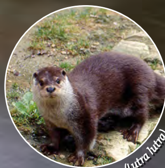
Loutre ( Lutra lutra )