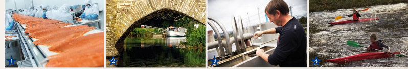
1 - Industrie agroalimentaire. (© A. Lamoignon). 2 - Navigation fluviale. (© Aulne Loisir Plaisance). 3 - Production d'eau potable. (© A. Lamoignon). 4 - Tourisme Vert. (© A. Lamoignon)