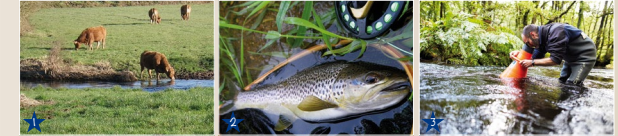
1 - Élevage bovin. (© EPASA). 2 - Pêche sportive. (© A. Lamoignon). 3 - Sauvegarde de la Mulette. (© A. Lamoignon)