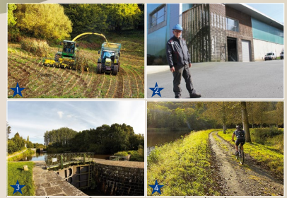
1 - Agriculture céréalière. (© A. Lamoignon). 2 - Epuration des eaux. (© Ville de Carhaix) 3 - Patrimoine historique. (© A. Lamoignon). 4 - Tourisme Vert. (© A. Lamoignon)