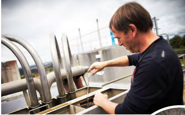
Usine de Coatigrac'h, Syndicat Mixte de l'Aulne.

De nombreuses activités économiques du territoire en dépendent. Il importe donc de rester vigilant et d'éviter qu'elle ne se dégrade.