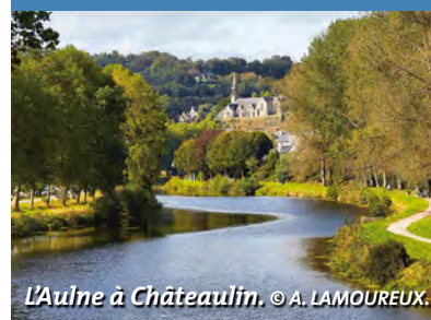
L'Aulne à Châteaulin.

Impossible de savoir s'il provient d'une traduction de l'appellation du fleuve en Breton : « Ster Aon » dérivé de ster aven qui signifie « profonde rivière » ou bien s'il a été inspiré par les arbres qui poussent sur ses berges : les aulnes. Aidez-nous à résoudre ce mystère et contactez-nous !