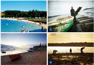
1 - Baignade. (© Mairie de Lannéac). 2 - Canyotisme. (© A. Lamoignon). 3 - Navigation de plaisance. (© A. Lamoignon). 4 - Pêche à pied. (© A. Lamoignon)