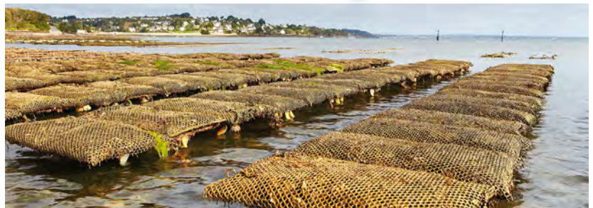
Tables à huîtres.

L'Aulne et ses affluents se déversent dans la rade de Brest. Ils y apportent de grandes quantités de matières en suspension et dissoutes. Les fragiles écosystèmes marins et les activités humaines qui en dépendent peuvent s'en trouver déstabilisés.