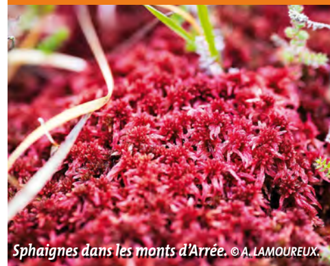
Sphaignes dans les monts d'Arrée.

Abonnez-vous à la version électronique de cette lettre « Au fil de l'Aulne » en envoyant une demande à : accueil@epaga-aulne.fr