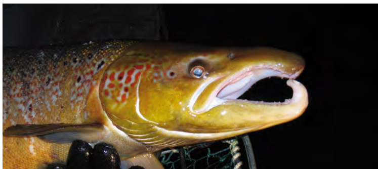
Salmon ( Salmo salar ).