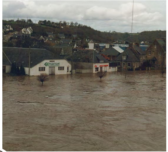
Châteaulin durant l'inondation de janvier 1995.