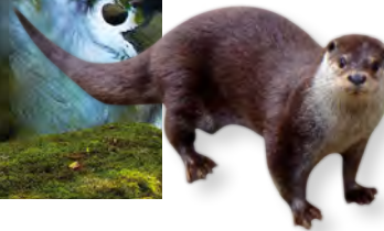
Loutre ( Lutra lutra ).