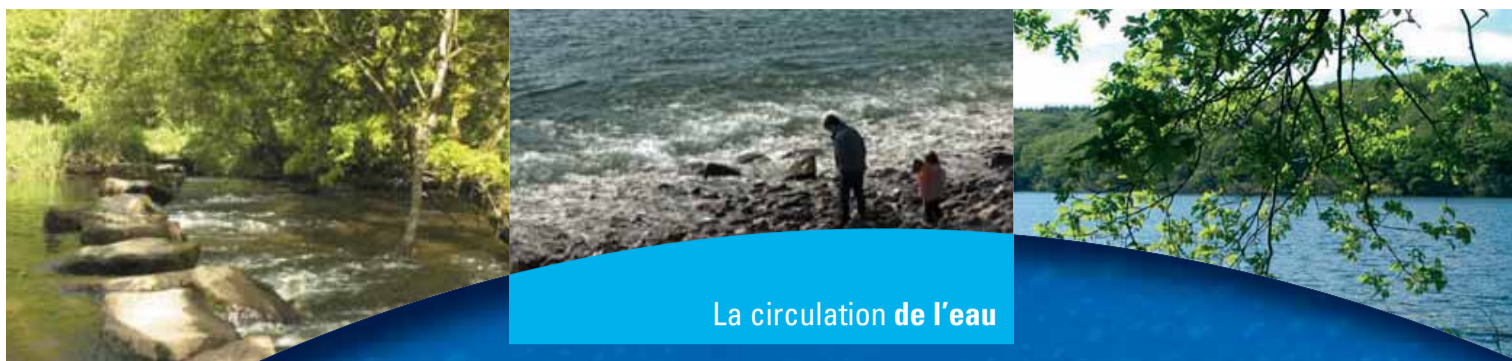
La circulation de l'eau