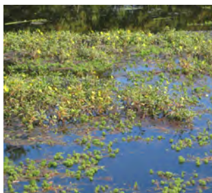
Plan d'eau totalement colonisé par les jussies