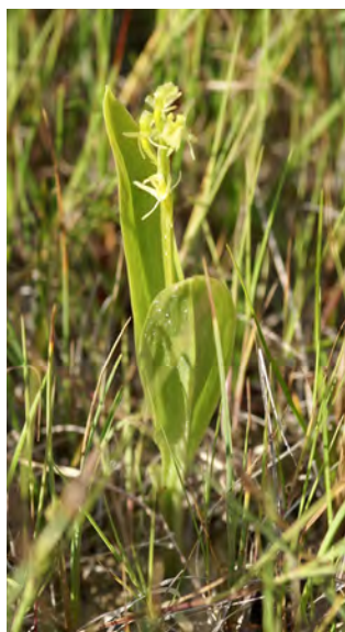
Le Liparis de Loesel est une orchidée rarissime dans le Finistère, menacée par l'expansion de certaines invasives comme l'Herbe de la pampa ou le Sénéçon en arbre.

Certaines plantes invasives (Berce du Caucase, ambroisie...) peuvent s'avérer irritantes pour les voies respiratoires et la peau, voire allergisantes. D'autres comme les élodées peuvent conduire à l'asphyxie des plans d'eau servant à l'alimentation en eau potable.