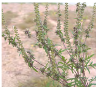
L'Ambrosie pose de graves problèmes de santé