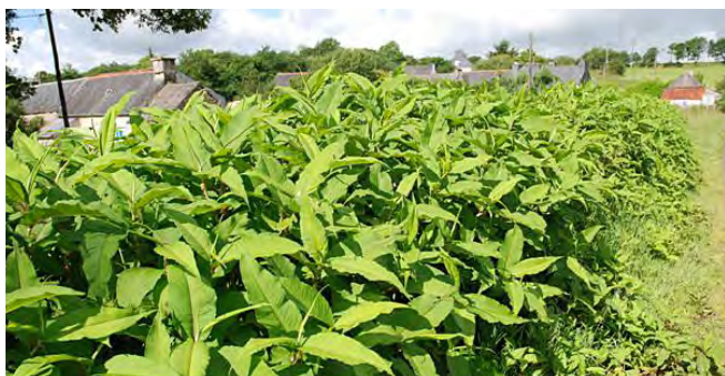
Polygonum polystachyum en bordure de route

Les renouées sont dotées d'une capacité de reproduction très puissante, essentiellement par le développement des tiges souterraines et par bouturage. Elles sont aujourd'hui assez répandues dans le département et forment de véritables massifs le long des cours d'eau et des bords de route. Elles sont responsables d'une baisse importante de la biodiversité, notamment en bordure des rivières.