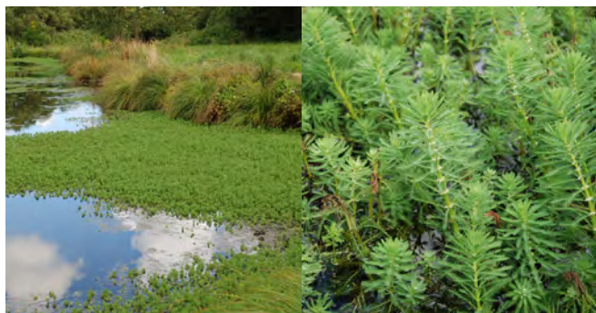
Myriophylle du Brésil colonisant un étang du nord Finistère