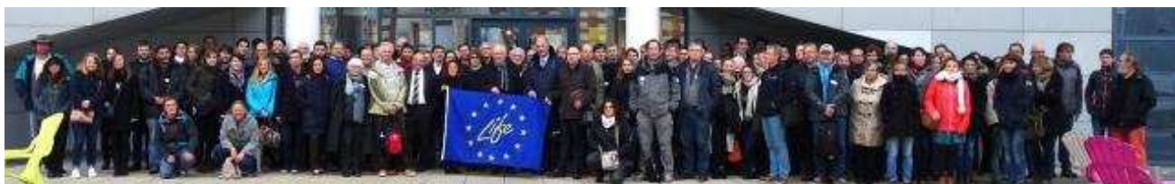
Plus de 210 participants au colloque final du projet Life Pêche à pied de loisir (24/12/2016)

Pour le territoire des estuaires picards et de la mer d'Opale, 17 panneaux ont été installés sur environ 90 km de côte, du cap Gris Nez (commune d'Audinghen) au gois de Cise (commune d'Ault). Dans le golfe normand breton, 66 panneaux sont prévus (35 financés par l'Agence des aires marines protégées et 31 par les communes) d'Erquy à Surtainville (sur les 3 départements des Côtes d'Armor, d'Ille-et-Vilaine et de la Manche).