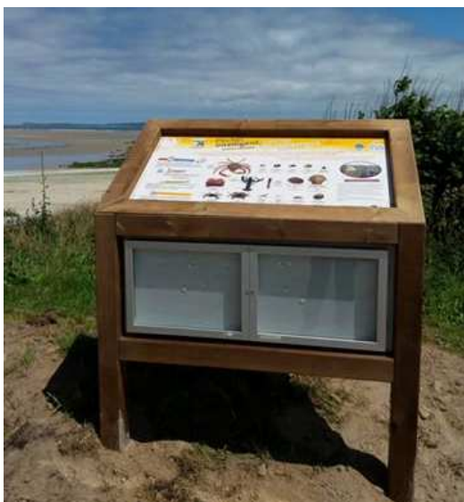
Panneau d'information sur le territoire Morlaix Trégor