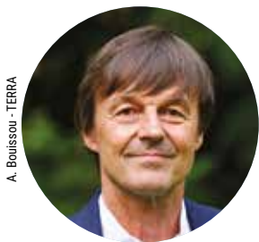
A. Bouissou - TERRA