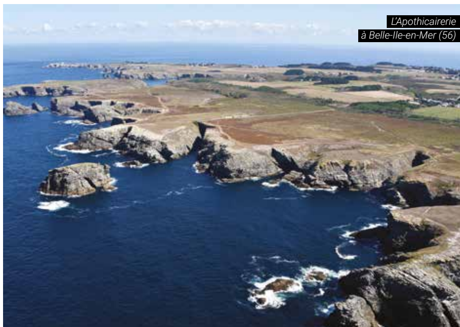
E. Le Cornec

“ La banque de semences du sol résiduel (biodiversité latente) et l'environnement végétal (biodiversité potentielle) assurent la reconquête de la flore et de la végétation. Ainsi, la restauration passive s'avère le plus souvent suffisante et souhaitable mais, il faut admettre un temps de réponse long ; paradoxalement, plus il sera long, plus la qualité des habitats objectifs sera remarquable. L'oligotrophie du milieu est le meilleur gage de la réussite de l'opération de restauration de ces habitats d'intérêt communautaire. ”