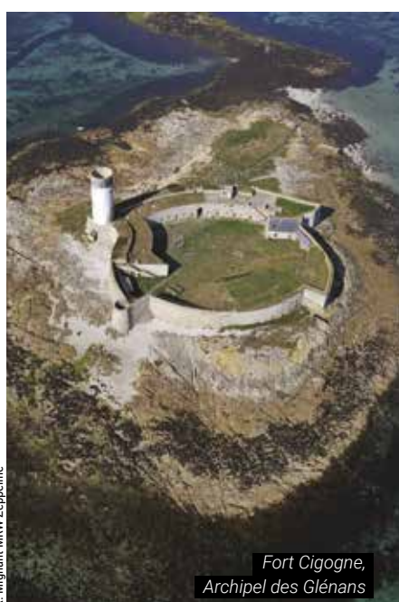
Fort Cigogne, Archipel des Glénans

CONTACT : Délégation Bretagne bretagne@conservatoire-du-littoral.fr