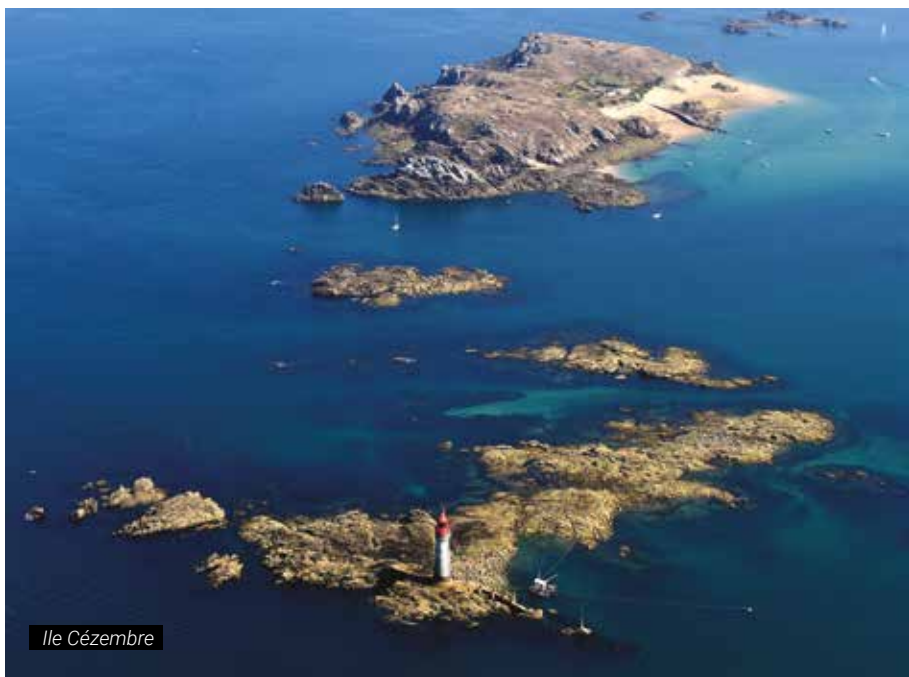
E. Le Cornec

Après y avoir laissé les traces meurtrières, nous ne pouvons pas nous permettre d'en laisser de nouvelles irréversibles, que ce soit de près, par la pollution touristique, ou de loin, par le changement climatique et la montée des eaux.