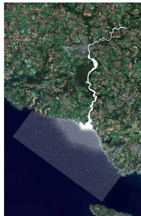
Emprise du modèle hydraulique élaboré

Curage de la Laïta définitivement écarté