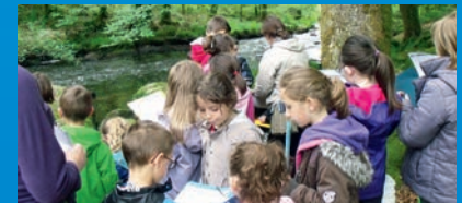
École publique de Plouray, le 22 mai 2015