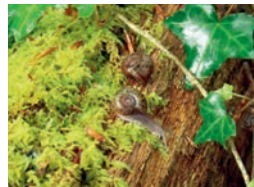
Escargot de Quimper