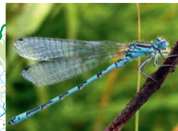
Agrion de mercure

12 ESPÈCES ET 10 HABITATS D'INTÉRÊT COMMUNAUTAIRE