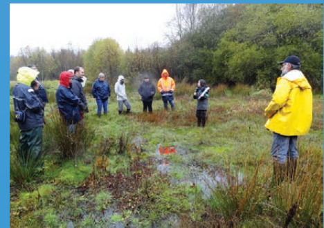
La réserve naturelle régionale de Magoar-Penvern à Glomel

* AMV : Association de Mise en Valeur des sites naturels de Glomel