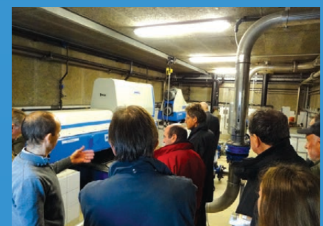
La nouvelle STEP de Clohars-Carnoët