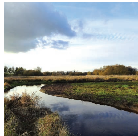
Nouveau méandre de l'Ellé

Dans le cadre du CTMA* Ellé amont porté par Roi Morvan Communauté, la Fédération de Pêche du Morbihan a conduit en octobre dernier une première phase de travaux pour remettre l'Ellé dans son ancien lit en amont de la prise d'eau de Pont Saint Yves. Avec l'appui d'anciennes données cartographiques, c'est un nouveau tracé avec méandres de 350 m qui remplace 230 m de cours d'eau rectiligne , pour un investissement de 10 000 €. L'objectif : rétablir les capacités de la rivière à déborder (lutte contre les inondations en aval) et à recharger les nappes souterraines (préservation de la ressource en eau potable).