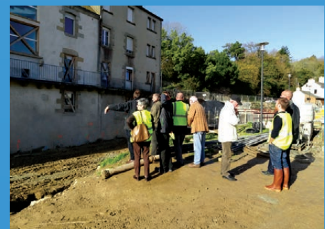
Les travaux de confortement des berges de l'Isolle en basse-ville de Quimperlé