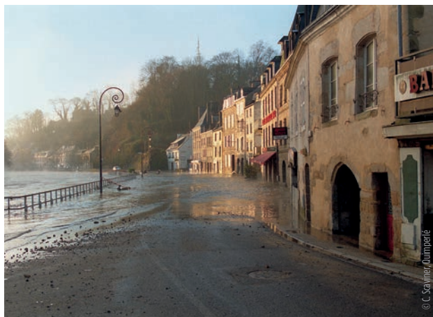
Inondation du quai Brizeux à Quimperlé, décembre 2000

L'hiver arrive et avec lui, la vigilance face aux éventuelles inondations grandit sur Quimperlé et les entreprises situées en bord de rivières. Alors que majoritairement, c'est l'aval qui est touché, il est nécessaire d'opérer à l'échelle du bassin versant tout entier pour lutter efficacement contre les inondations.