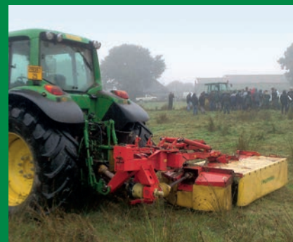
Rencontre à Mellac, le 19 septembre

À l'initiative du SMEIL et co-organisées avec les Chambres d'Agriculture et les Comités de développement, ces rencontres ont permis aux agriculteurs d'échanger et de témoigner sur les sujets suivants : la valorisation des prairies humides, les systèmes d'abreuvement à adopter, la problématique du parasitisme et des franchissements de cours d'eau... Elles se sont conclues par une démonstration de matériels (broyeurs d'accotement et satellites, épaveuses, entretien sous clôture...) et des discussions animées autour d'un verre de l'amitié.