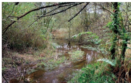
Ancien méandre réactivé du Roz Millet

Roi Morvan Communauté a conduit à l'automne sur Langonnet, les premiers travaux de renaturation prévus au CTMA Ellé amont. L'objectif : permettre au ruisseau du Roz Millet de regagner ses anciens méandres sur une partie de son cours par la création de deux seuils empierrés et ainsi restaurer l'habitat aquatique sur 160 m de long.