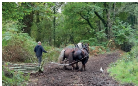
Les chevaux de trait de l'entreprise Seité au travail dans les Guerns

Sous maîtrise d'ouvrage de la ville de Quimperlé et avec l'appui du SMEIL et de Lorient Agglomération, le contrat Natura 2000 sur les « Guerns » prévoit l'abattage de saules sur 1 ha. Dans ce cadre, une expérimentation de débardage à cheval a été menée en septembre et a donnée des résultats plutôt positifs avec plus de 1 000 m 2 de saules abattus en 5 jours. Le bois broyé sera utilisé en paillage sur les espaces verts de la ville.