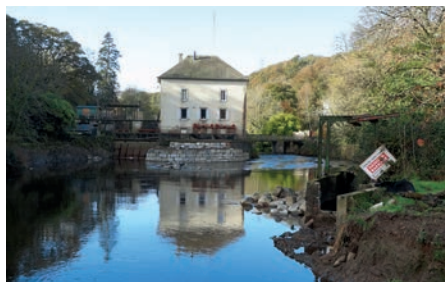
L'Ellé au moulin de la Mothe après travaux

Propriété de la Fédération de pêche du Finistère, à Quimperlé, le barrage du moulin de la Mothe faisait partie des ouvrages à aménager d'ici 2012, pour restaurer la libre circulation des espèces et des sédiments (« ouvrages prioritaires grenelle »). C'est chose faite avec les travaux d'effacement qui se sont déroulés cet automne pour permettre la restauration de la continuité écologique sur ce secteur aval de l'Ellé.