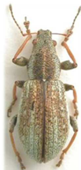
Polydrusus confluens

de chrysomela ; 3 ex., Santec, Finistère (29) 1890 ; 1 ex., Tréguier, Côtes-d'Armor (22) 1877 (N°1346). Toute l'Europe jusqu'à la Russie.