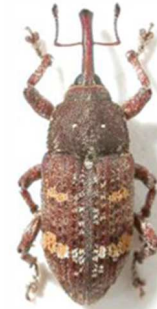
Pissodes castaneus

5 ex., Morlaix, Finistère (29) sous le nom de notatus ; 1 ex., Col de la Perche, La Perche, Pyrénées-Orientales (66) sous le nom de notatus (N°1263). Toute l'Europe.