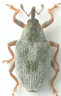
Drupenatus nasturtii

2 ex., Morlaix, Finistère (29) ; 3 ex., Bonifacio, Corse, (N°1863). Espagne, France, Corse, Italie, Sardaigne, Sicile, Belgique, Pays-Bas, Angleterre, Allemagne, Suisse, Autriche, Slovénie, Croatie, Bulgarie, Turquie.