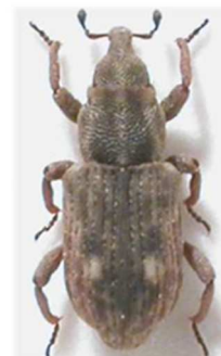
Bagous lutulosus

1 ex., Kerfaven, Ploujean, Finistère (29) 1884 ; 1 ex., Coatconggar, Ploujean, Finistère (29) 1882 ; 1 ex., Le Launay, Plougasnou, Finistère (29) 1885 (N°7569). Europe, Russie.