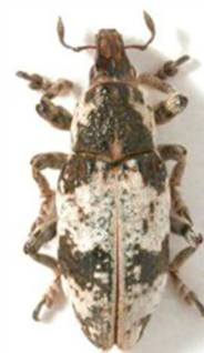
Bothynoderes affinis

4 ex., Lannidy, Plouigneau, Finistère (29) sous le nom de Chromoderus fasciatus ; 1 ex., Santec, Finistère (29) sous le nom de Chromoderus fasciatus ; 1 ex., Saint-Pol-de-Léon, Finistère (29) sous le nom de Chromoderus fasciatus (N°2469). Toute l'Europe.