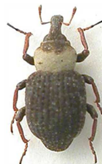
Bagous petro

6 ex., Lille, Nord (59) (N°9668) ; 1 ex., Marly-le-Roi, Yvelines (78) sous le nom d' aubei (N°7611). Angleterre, France, Pays-Bas, Allemagne, Danemark, Italie, Autriche, Hongrie, Tchéquie, Slovaquie, Pologne, Suède, Finlande, Estonie, Lettonie.