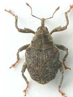
Parethelcus pollinarius (  RL)

5 ex., Morlaix, Finist re (29) (N 2041). Europe enti re, Scandinavie, Russie, Turquie.