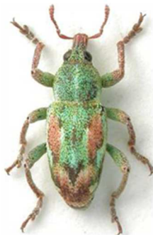
Coniatus tamarisci

5 ex., sud de la France (N°816) ; 1 ex., Mont-Louis, Pyrénées-Orientales (66) var. deyrollei (N°5419). Portugal, Espagne, Baléares, France, Corse, Italie, Sardaigne, Sicile, Grèce, Crète, Turquie, Chypre.