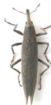
Lixus paraplecticus

Une partie de l'Europe, Russie, Turquie.