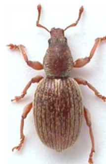
Pleurodirus fairmairei

4 ex., Barcelone, Espagne, sous le nom d' ovipennis (N°6928). Sud de la France, Espagne.