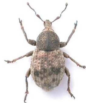
Tropiphorus cucullatus (© RL)