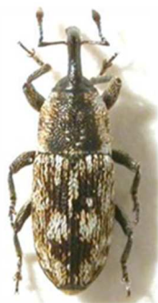
Cosmobaris scolopacea

1 ex., Piémont, Italie (N°5424) sous le nom d' Aulacobaris villae . France, Italie, Sicile, Autriche, Hongrie, Roumanie, Turquie.