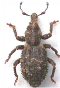
Dichotrachelus verrucosus

1 ex., Vernet-les-Bains, Pyrénées-Orientales (66) (N°1819). Espagne (Pyrénées), France (Pyrénées).