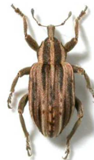
Hypera arator (© RL)