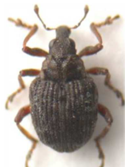
Pelenomus canaliculatus