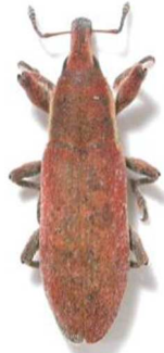
Lixus vilis