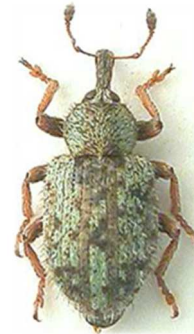
Limobius borealis

6 ex., Morlaix, Finistère (29) ; 2 ex., Rouen, Seine- Maritime (76) (N°2054). Europe entière.