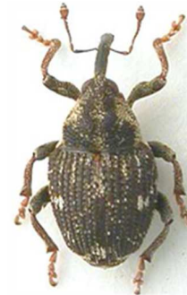
Nedyus quadrimaculatus (  RL)

5 ex., Morlaix, Finist re (29) (N 2249). Toute l'Europe, Russie, Turquie.