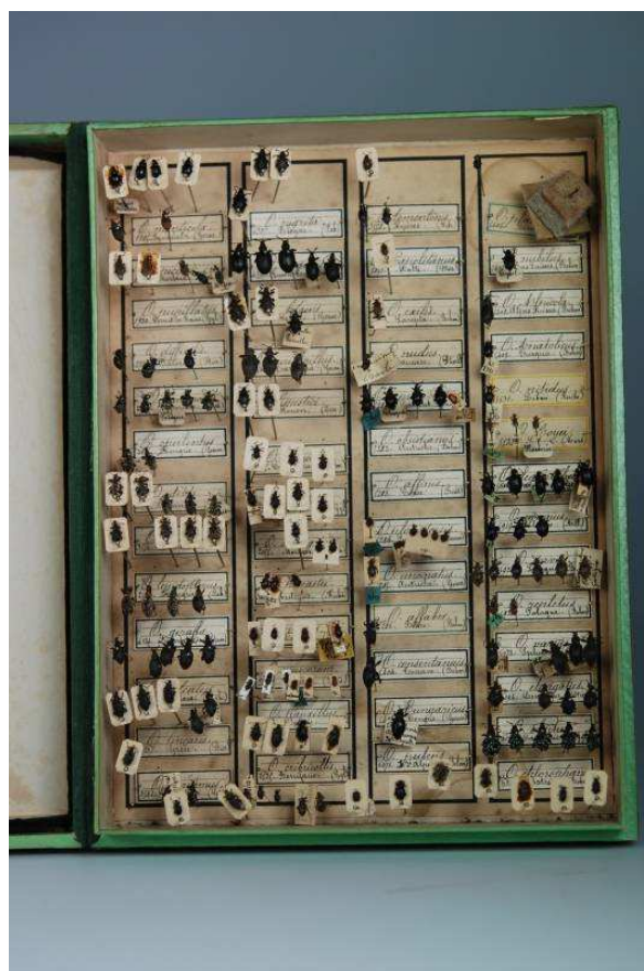
Boite de la collection Ernest Hervé

5 ex., Mont-Louis, Pyrénées-Orientales (66) ; 1 ex., Menton, Alpes-Maritimes (06) ; 1 ex., Cannes, Alpes- Maritimes (06) (N°4786). France, Corse, Croatie.