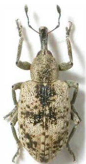
Hypera rumicis

4 ex., Morlaix, Finistère (29) ; 1 ex., Roscoff, Finistère (29) 1884 ; 1 ex., Huelgoat, Finistère (29) ; 1 ex., Digne, Alpes de Haute Provence (04) (N°2235). Toute l'Europe, Russie, Turquie.