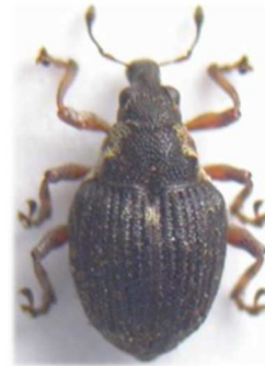
Pelenomus quadricorniger