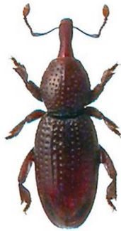
Ferreria marqueti (© RL)

1 ex., Menton, Alpes-Maritimes (06), France, Suisse, Italie, Croatie.