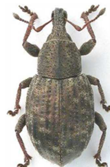
Tropiphorus elevatus

Europe centrale et septentrionale, Russie.