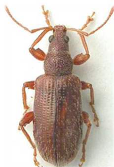
Phyllobius oblongus

Europe entière septentrionale et centrale.