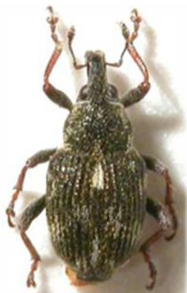
Rhinoncus perpendicularis

3 ex., Morlaix, Finistère (29) (N°3262) ; 1 ex., Morlaix, Finistère (29) sous le nom de subfasciatus ; 2 ex., Saint-Germain-en-Laye, Yvelines (78) (N°7583). Toute l'Europe, Russie, Turquie.