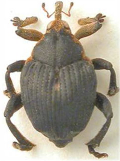
Mononychus punctumalbum (© RL)