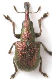
Rhynchites giganteus

France, Italie, Sicile, Autriche, Slovaquie, Hongrie, Slovénie, Croatie, Roumanie, Bulgarie, Grèce, Ukraine, Russie, Turquie.