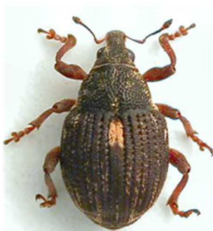
Rhinoncus pericarpus

6 ex., Morlaix, Finistère (29) ; 1 ex., Santec, Finistère (29) 1889 (N°1099). Europe entière, Russie, Turquie.