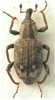
Bagous subcarinatus