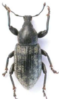
Barynotus squamosus (© RL)

France, Irlande, Angleterre, Islande, Danemark, Suède, Norvège.