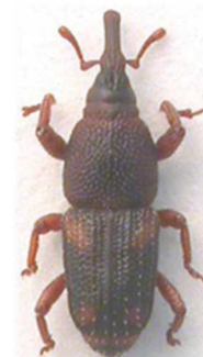
Sitophilus oryzae

4 ex., Morlaix, Finistère (29) ; 1 ex., Rouen, Seine- Maritime (76) (N°6166). Pratiquement toute l'Europe Russie, Turquie.