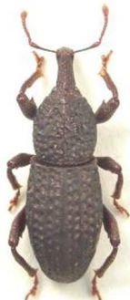
Mitoplinthus caliginosus

3 ex., Carinthie, Autriche ; 1 ex., Carniole, Slovénie (N°3567). Suisse, Autriche, Italie, Slovénie, Croatie, Ukraine.