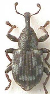
Tanysphyrus lemnae

6 ex., Morlaix, Finistère (29) (N°1329). Toute l'Europe.