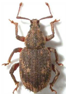
Caenopsis fissirostris

5 ex., Tréfeunténiou, Ploujean, Finistère (29), 1901 ; 1 ex., Pennalliorzou, Ploujean, Finistère (29) (N°2035). Espagne, Portugal, France, Belgique, Pays-Bas, Allemagne, Angleterre, Irlande.