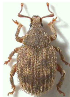
Caenopsis waltoni

1 ex., Kerarmel, Plouézoch, Finistère (29) ; 2 ex., Ploujean, Finistère (29), 1901 ; 1 ex., Roscoff, Finistère (29) 1891 (N°2036). France, Portugal, Espagne, Belgique, Allemagne.