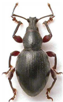
Otiorynchus atroapterus

Littoral atlantique et de la Manche, de l'embouchure de la Loire à la Somme, Europe du Nord, Angleterre, Irlande.