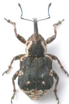
Grypus equiseti

3 ex., Morlaix, Finistère (29) (N°8871). Toute l'Europe, Scandinavie, Russie.