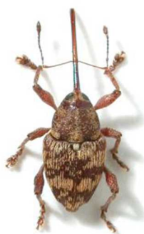
Curculio betulae

3 ex., Nyons, Drôme (26) sous le nom de cerasorum (N°1713). Europe moyenne et centrale, Russie, Turquie.