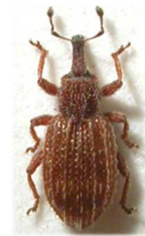
Orthochaetes insignis

6 ex., Morlaix, Finistère (29) (N°2339) ; 2 ex., îles Lavazzi, Corse (N°2339). Irlande, Angleterre, Portugal, Espagne, France, Corse, Italie, Sardaigne, Sicile.