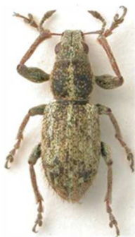
Andrion regensteinense

7 ex., Morlaix, Finistère (29) (N°461). Europe, Russie.