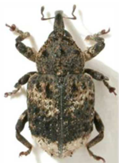
Cryptorhynchus lapathi (© RL)

Toute l'Europe, Scandinavie, Russie, Turquie.