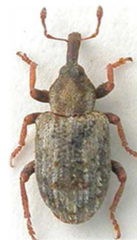
Limobius mixtus (© RL)

4 ex., Santec, Finistère (29) ; 1 ex., Villeneuve-sur- Lot, Lot-et-Garonne (47) (N°3702). Angleterre, France, Belgique, Pays-Bas.