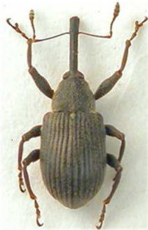
Anthonomus rubi

2 ex., Morlaix, Finistère (29) (N°1100). Toute l'Europe, Russie, Turquie.