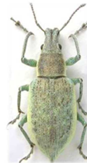
Chlorophanus viridis viridis

Chlorophanus sellatus (Fabricius, 1798) 4 ex., Turquie (N°7032). Russie.