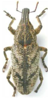
Cleonis pigra