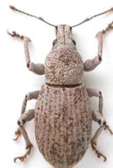
Geonemus flabellipes