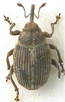
Amalorrhynchus melanarius (© RL)

1 ex., France, localité non signalée (N°8054). Europe moyenne et centrale, Turquie.