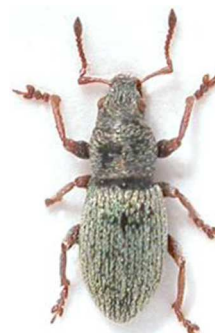
Pleurodirus murinus

1 ex., sud de la France (N°5267) ; 4 ex., Nyons, Drôme (26) sous le nom de globosus (N°8873). Sud de la France.