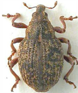
Rhinoncus inconspectus (© RL)