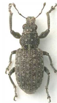
Coelositona cambricus

3 ex., Pannelé, Saint-Martin-des-Champs (29) 1892 (N°2342). Europe de l'Ouest, Turquie.