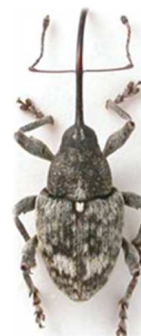
Curculio villosus

3 ex., Morlaix, Finistère (29) (N°2558). Europe, Russie, Turquie.