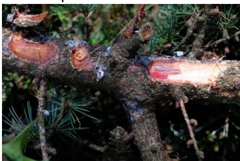
▲ Nécrose sur branche de mélèze

Les recherches se poursuivent. En cas de symptômes, contactez les correspondants observateurs du DSF pour une confirmation du diagnostic.