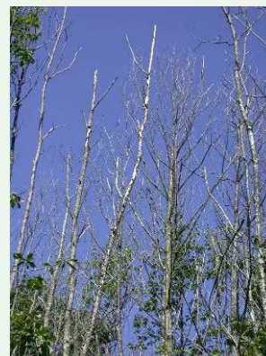
▲ Dépérissement massif de châtaignier

● Premier cas de puceron lanigère sur peuplier I 214 dans le nord de l'Ille-et-Vilaine.