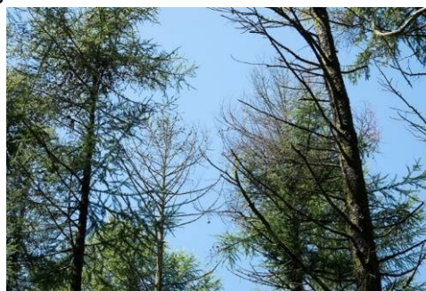
▲ Descente de cime de mélèze