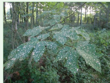
▲ Maladie des taches blanches sur feuilles d'érable

Un foyer de cynips du châtaignier a été observé en limite de la Mayenne. Cet hyménoptère provoque des galles de couleur verte teintées de rose de 5 à 20mm entraînant une forte réduction de la fructification et une baisse de la surface foliaire. Son impact forestier reste très limité d'autant qu'un prédateur naturel a été introduit avec succès dans certaines régions.