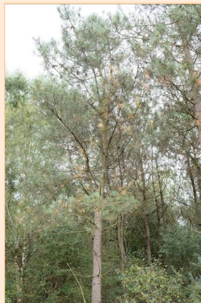
Mortalités de branches sur pin maritime suite à la sécheresse ↗

Malgré cette alternance d'évènements forts, la croissance des arbres, en particulier des jeunes plantations, a été bonne. Cependant, le déficit hydrique de la fin de saison laisse présager un risque de démarrage difficile de la végétation en 2017.