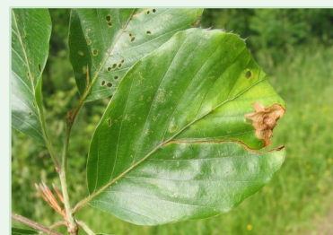
▲ Dégâts d'orcheste sur hêtre

Le printemps humide de cette année a favorisé le développement d'un pathogène foliaire sur érable. Ce champignon provoque des taches blanches criblant les feuilles des érables, et peut conduire à leur dessèchement et à leur chute. Cette maladie n'occasionnerait qu'une faible perte de croissance des arbres affectés. Le retour à un climat plus favorable devrait résoudre le problème.