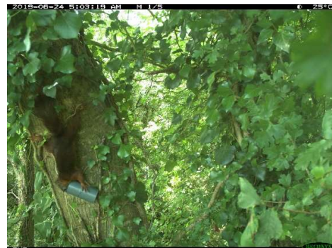
Piège photo : photo d'un écureuil en flagrant délit de consommation d'un appât destiné au Lérot