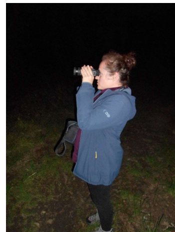
Prospection monoculaire de vision nocturne