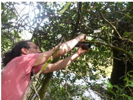
Pose de pièges à poils