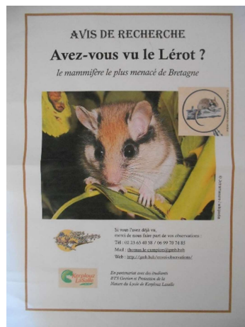
Affiche « avis de recherche Lérot »

Hormis sur le dernier site équipé où nous avons récolté des traces non identifiables (pas des traces d'empreintes de pattes), seule la station de Larmor Baden a recueilli des empreintes de micromammifères. Ces empreintes appartiennent cependant à un probable mulot/souris.