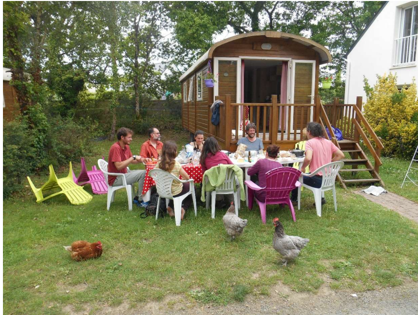
Moment convivial au pied de notre roulotte et en compagnie de poules voraces