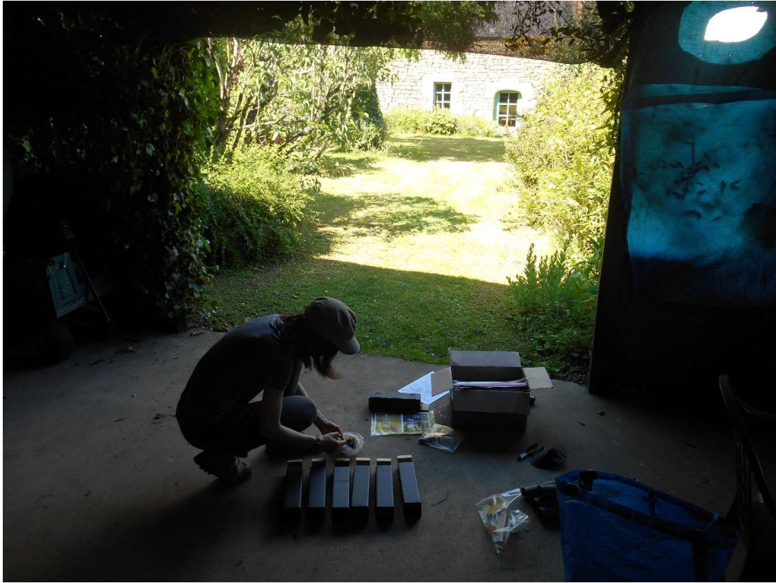
Préparation des pièges à empreintes

Groupe Mammalogique Breton ● www.gmb.bzh