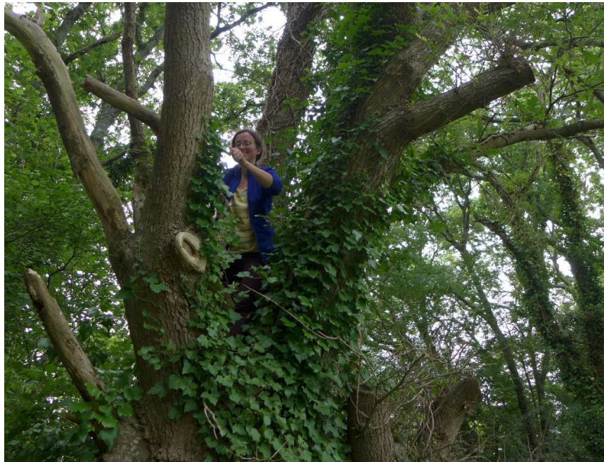
Grimpe d'arbre pour fixation de pièges capteurs d'indices