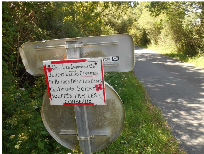
Sensibilisation à l'environnement !