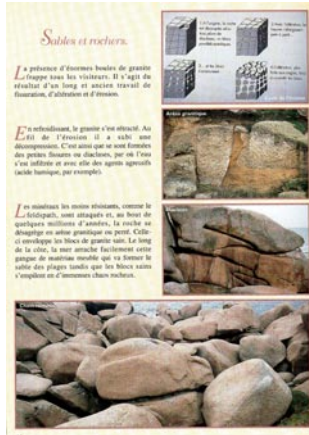
Page du livret-guide du sentier de découverte dans les rochers de Ploumanac'h, Perros-Guirec, Côtes-d'Armor.