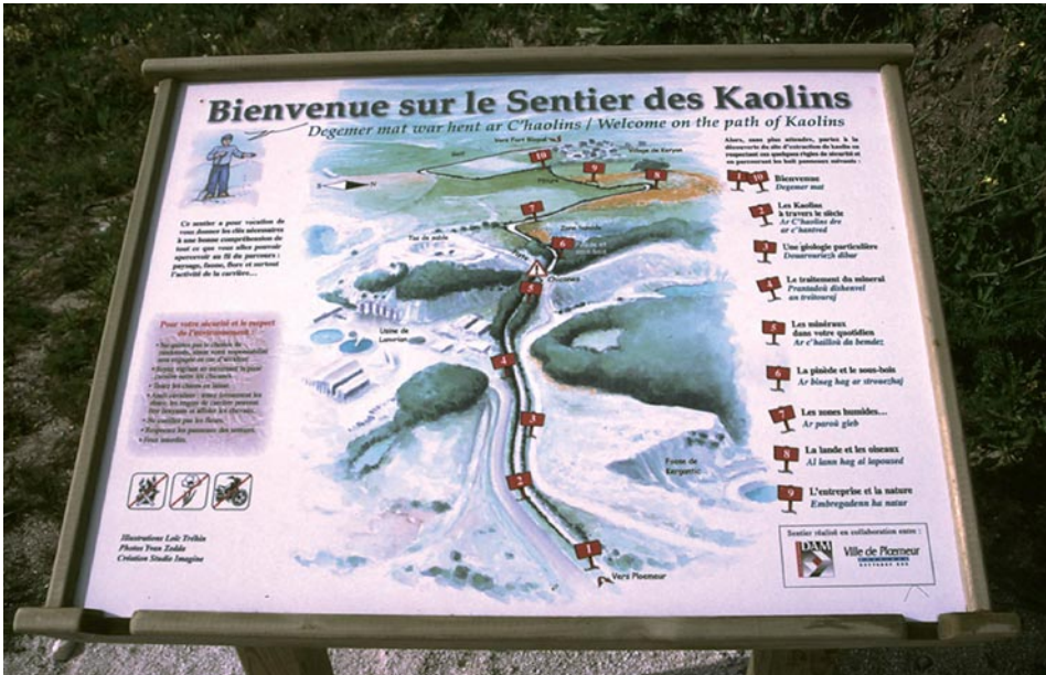
Pupitre explicatif du sentier des kaolins à Ploemeur, Morbihan.

Pour rester dans le domaine des argiles, à Saint-Jean-la-Poterie, la Maison de la Potière et le sentier d'interprétation créés il y a près d'une vingtaine d'années ne remplissent plus aujourd'hui leur fonction de médiation et de transmission de la mémoire, faute d'animations.