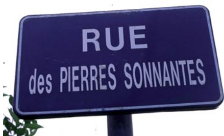
Plaque de rue des Pierres sonnantes à Saint-Cast-le-Guildo, Côtes-d'Armor.

En matière de médiation, elles restent heureusement fort rares, ne prêtant la plupart du temps pas à conséquences. À Saint-Cast-Le Guildo (Côtes-d'Armor) cependant, en bordure de l'Arguenon, un site touristique signalé dans de nombreux guides, intrigue par son appellation : c'est celui des Pierres Sonnantes. Sur le rivage on trouve en effet des blocs arrondis d'une roche sombre, remarquables par le son qu'ils émettent lorsqu'on les frappe avec un objet quelconque.