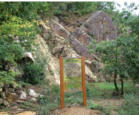
Panneau explicatif de la discordance de la carrière des Landes (site classé), Guichen, Ille-et-Vilaine.

Au sud, dans la région de Messac, la Vilaine traverse en un grand méandre et en cluse une barre de grès dans le site réputé de Corbinières . Là, le Conseil général y a acquis un ensemble boisé parcouru aujourd'hui par un sentier de découverte qui laisse découvrir la roche stratifiée dont une borne pédagogique explique la disposition.