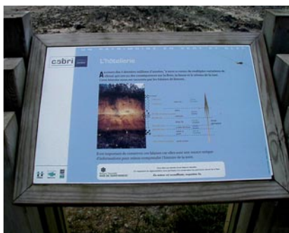
Pupitre explicatif de la coupe de la falaise de l'Hotellerie dans les sédiments quaternaires, Hillion, Côtes-d'Armor.

Toujours sur la côte, au fond de la baie de Saint-Brieuc la Maison de la Baie d'Hillion , il y a peu restructurée, joue le rôle d'accueil et d'information de la réserve naturelle. Par le biais de sorties nature, d'animations pédagogiques, de publications, de supports audiovisuels, d'équipements muséographiques et d'expositions temporaires, chacun peut y trouver une somme d'informations notamment géologiques. Sur le chemin des douaniers, autour d'une table d'orientation, sont placées des maquettes sur la géologie, des « cailloux à toucher ».