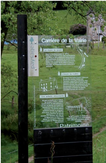
Un des panneaux implanté au long du Circuit Pierres et nature à Mellé, Ille-et-Vilaine.

Non loin de là, à Locarn, village marqué par la richesse de son sous-sol situé « à cheval » entre le massif granitique de Quintin et le bassin schisteux de Châteaulin, la Maison du Patrimoine gérée par l'association Cicindèle, offre, entre autres, aux visiteurs la possibilité de s'informer sur le granite, sa géologie, son mode de formation, son utilisation architecturale ainsi que sur le schiste ardoisier de Maël-Carhaix dans lequel il s'est mis en place ; de la rencontre de ces deux roches sont nés des paysages uniques de landes et de chaos granitiques. Une exposition permanente fait découvrir les liens unissant les habitants du centre Bretagne à la pierre, qu'elle soit de schiste ou de granite. Un tunnel minier reconstitué guide le visiteur vers les ardoisiers qui racontent l'extraction du schiste. Un peu au Sud du bourg, le sentier de découverte du bois de Mezle permet de visualiser cette histoire dans les ruines d'anciennes exploitations.