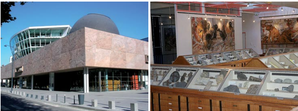
À gauche : le bâtiment des Champs-Libres qui abrite l'Espace des sciences à Rennes, Ille-et-Vilaine ; à droite : la salle de géologie générale du Musée de géologie de l'université de Rennes 1, campus de Rennes-Beaulieu, Ille-et-Vilaine.

Les scolaires, collégiens, lycéens ou autres associations sont nombreux à le fréquenter pour des visites commentées. La médiation y est donc active, son point fort étant lié à l'existence d'importantes collections et à sa proximité avec les « acteurs » de la science.