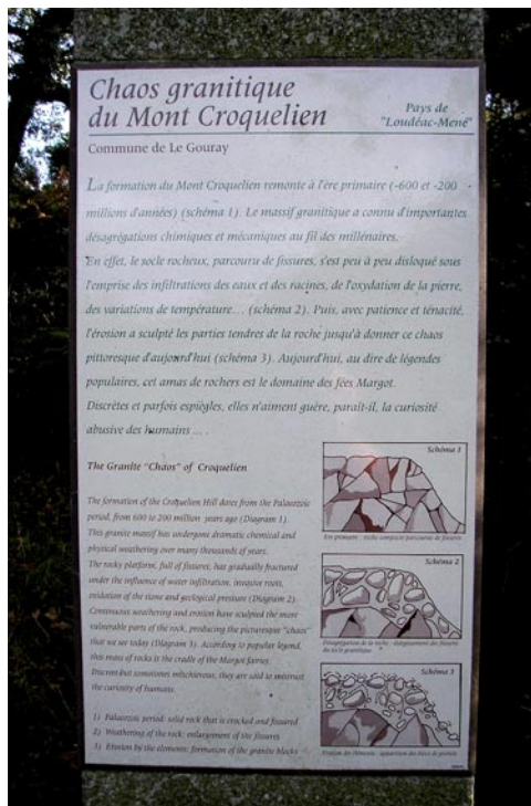
Panneau explicatif de la formation du chaos granitique de Croquélien, Le Gouray, Côtes-d'Armor.

Plus connue des géologues, notamment des quaternaristes, la Plage de l'Hôtellerie à Hillion (Côtes-d'Armor) a été équipée, par la Communauté de l'agglomération briochine (CABRI), d'un petit pupitre décrivant la superposition des couches visibles dans la falaise proche. Les informations qui y figurent datent et mériteraient d'être revues.