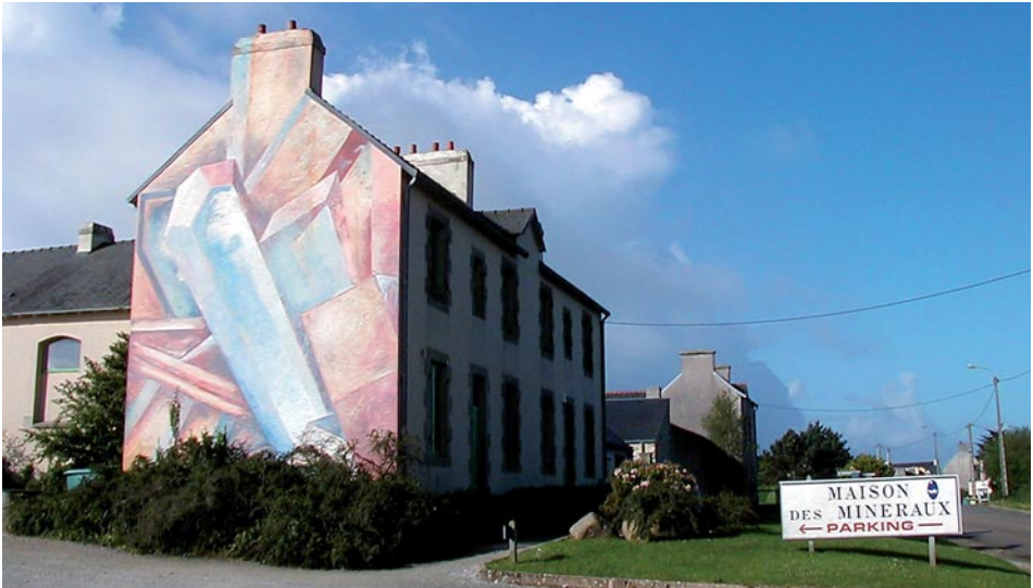
La Maison des minéraux de Saint-Herlot, Crozon, Finistère.

À Crozon, la Maison des minéraux de Saint-Herlot, structure muséale permanente du Parc Naturel Régional d'Armorique (PNRA), a été réalisée à la fin des années 80 autour de la collection minéralogique et pétrographique François le Bail pour faire connaître et valoriser la remarquable géologie de la presqu'île. Idéalement située sur la route touristique menant au cap de la Chèvre, elle dispose aujourd'hui d'une palette très complète d'outils de médiation qui vont des salles d'exposition jusqu'à l'utilisation des réseaux de communication sur le web en passant par les médias écrits. Il faut souligner l'importance de ses activités de terrain, non seulement en presqu'île mais plus largement dans l'Ouest Bretagne en direction des scolaires de tous niveaux, des groupes d'adultes et du grand public, réalisées sous la houlette de médiateurs de qualité.