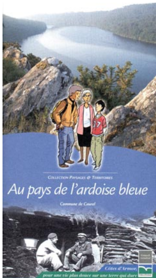
Couverture du livret-guide du sentier de Caurel, Côtes-d'Armor, Conseil général des Côtes-d'Armor.

Dans la plupart des cas, l'offre géologique se trouve intégrée au linéaire de sentiers de découverte ou d'interprétation qui, proposant une approche multidisciplinaire de la nature, intègrent, lorsque cela s'impose, le volet géologique. La médiation s'opère au moyen de livret-guides, de panneaux, de pupitres, de bornes, etc.