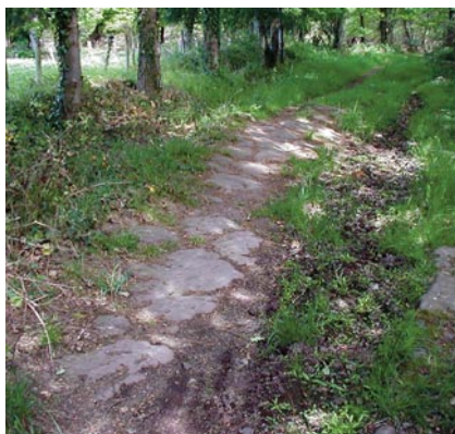
Sentier « pavé » de schistes rouges sur le Circuit géologique de Montfort-sur-Meu, Ille-et-Vilaine.

à la force des pieds. De ce point de vue, l'outil de médiation idéal s'avère être le parcours linéaire ou en boucle. En Bretagne, le seul sentier de découverte spécifiquement dédié à la géologie est en Ille-et-Vilaine le sentier géologique de Montfort-sur-Meu qui depuis 15 ans fait partie de l'offre naturaliste de l'Ecomusée du Pays de Brocéliande. Long d'une douzaine de kilomètres, il est balisé en tant que tel par des marques vertes ; initialement chaque point d'observation était équipé de plaques informatives qui, malheureusement, ont été assez rapidement vandalisées. Aujourd'hui pour le pratiquer et en tirer toute la substantifique moelle, il faut se munir du livret-guide disponible à l'écomusée.