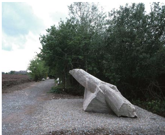
Le « sentier des roches » au moment de son aménagement à Quévert, Côtes-d'Armor.

quelque sorte son patrimoine naturel, d'abord botanique, en réhabilitant le tracé d'une ancienne voie de chemin fer qui traversait sa commune, puis en 1993 son patrimoine géologique en prolongeant ce tracé. Ainsi est né le Chemin des roches de Quévert au long duquel ont été placés des blocs prélevés dans différentes carrières des Côtes-d'Armor et du Morbihan. Les échantillons sont regroupés par grandes familles de roches dont le mode de formation et l'âge sont donnés sur des panneaux à l'entrée du chemin.