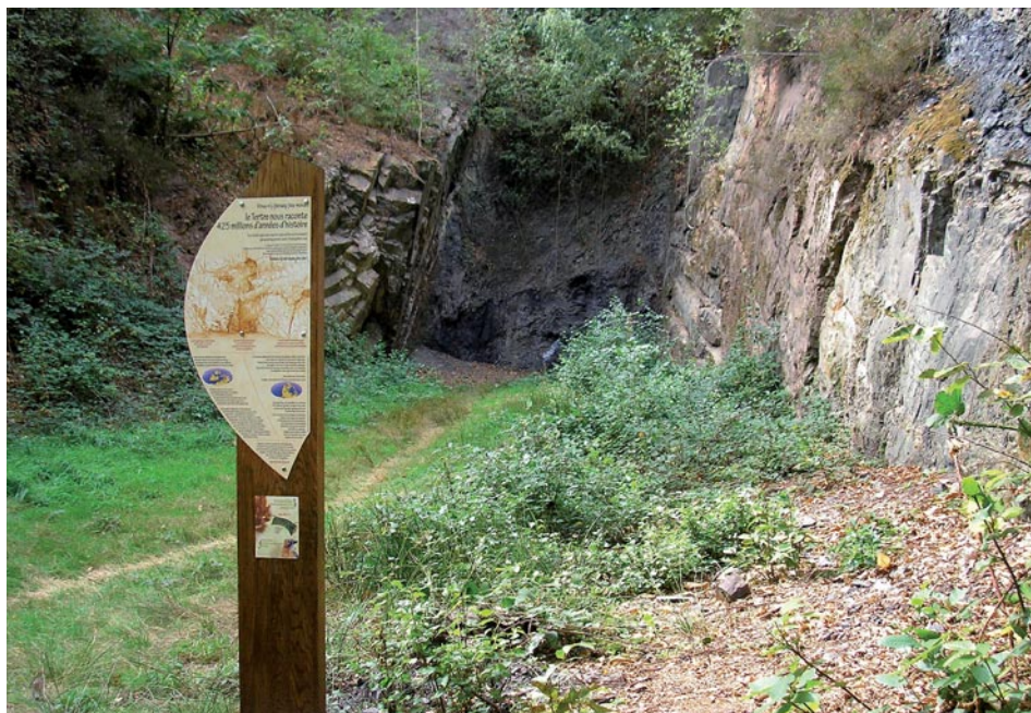
Panneau du site du « volcan » sur le Tertre Gris à Poligné, Ille-et-Vilaine.

Un peu au nord de Bain-de-Bretagne, en bordure de la voie rapide Rennes-Nantes, le site touristique du Tertre Gris est depuis longtemps fréquenté pour ses paysages, sa flore (asphodèles) mais aussi pour sa légende du Volcan qui intrigue toujours. À l'initiative des trois communes concernées (Poligné, Pancé et Pléchâtel) un circuit d'interprétation, inauguré en 2006, relie les stations de découverte floristique, géologique, légendaire. L'offre médiatique y est très fournie puisque le sentier du Tertre Gris est équipé tout au long de son dénivelé de grands cartels verticaux sur poteaux de bois au contenu élaboré et à l'esthétique évidente et à son sommet d'un pupitre de lecture du paysage à vocation ludique. Un petit livret disponible dans les communes complète l'équipement.