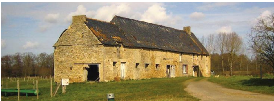
L'ancien corps de ferme appelé à devenir le centre d'interprétation des faluns à Tréfumel, Côtes-d'Armor.

domaine voient toujours le jour, puisque le projet muséographique d'un Centre d'interprétation des Faluns à Tréfumel, dans l'ancienne ferme de Carmeroc totalement repensée, devrait aboutir durant l'année 2012. La scénographie et la médiation promettent d'être à la hauteur, plongeant le visiteur dans la mer chaude qui barrait la partie orientale de la Bretagne il y a 15 millions d'années. L'environnement sous-marin y sera reconstitué avec la mise en place de vrais fossiles associés à des reconstitutions des espèces vivantes. La géologie locale, La faune et la flore terrestres, l'exploitation de la roche par l'homme ainsi que l'imaginaire ne seront pas oubliés.