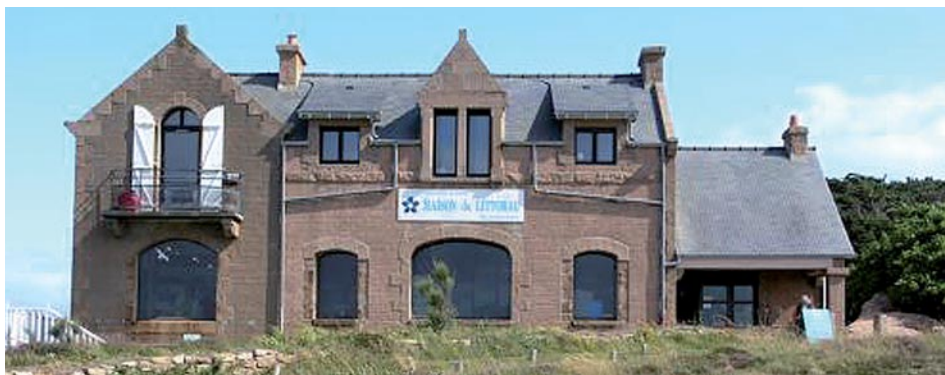
La Maison du littoral à Ploumanac'h, Perros-Guirec, Côtes-d'Armor.

C'est le cas de la Maison du littoral à Perros-Guirec au sein même des rochers qui font la réputation de la célèbre côte de granit(e) rose qui propose des animations, des balades, des randonnées mais aussi un espace muséographique qui fait la part belle au massif granitique de Ploumanac'h dans sa dimension géologique, ses particularités pétrologiques et l'utilisation de ses composants par l'homme, une boutique nature et des expositions temporaires.