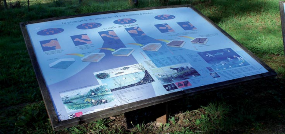
Pupitre explicatif des différents milieux successifs de l'Oligocène au Miocène à Lormandière, Chartres-de-Bretagne, Ille-et-Vilaine.

En Ille-et-Vilaine l'offre est plus disparate. C'est en premier lieu le sentier des Fours à chaux de Lormandière à Chartres-de-Bretagne réalisé par le Conseil général autour d'un patrimoine botanique implanté sur un substrat calcaire qui a été exploité pour l'industrie de la chaux ainsi qu'en témoignent des bâtiments industriels bien conservés. Les outils médiatiques sont ici in situ de grands pupitres qui commencent à dater, expliquant végétation, histoire industrielle mais aussi la géologie du lieu, même si elle est peu perceptible dans le paysage. L'un des « intérêts médiatiques » de ce site est la proximité de la ville de Rennes avec son vivier de visiteurs potentiels.