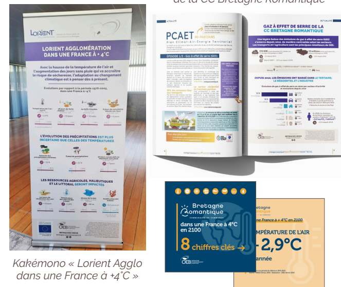
Kakémono « Lorient Agglo dans une France à +4°C »

Insertion dans le magazine communautaire de la CC Bretagne Romantique