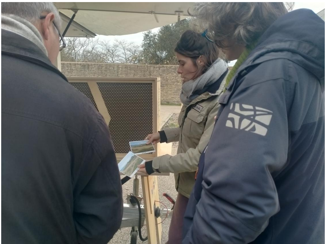
Présentation de la voyageuse par le Syndicat Mixte des Dunes Sauvages de Gâvres à Quiberon durant le temps du midi au COPIL des OPP Bretons ET MERCI POUR L'ACCUEIL !